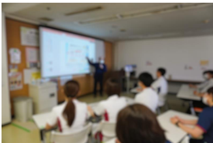
脳神経外科勉強会風景