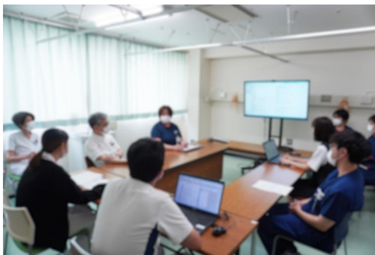
アドバンス・ケア・プランニング会議風景