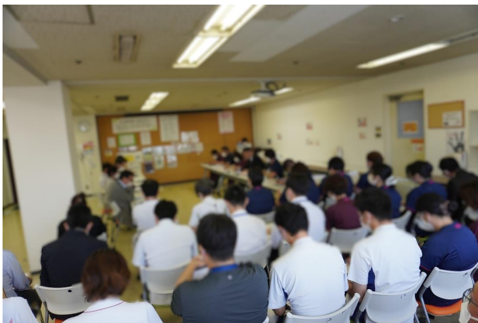
病院機能評価の総評の様子